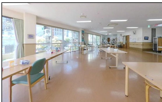
「施設内は明るく活気のある施設です」