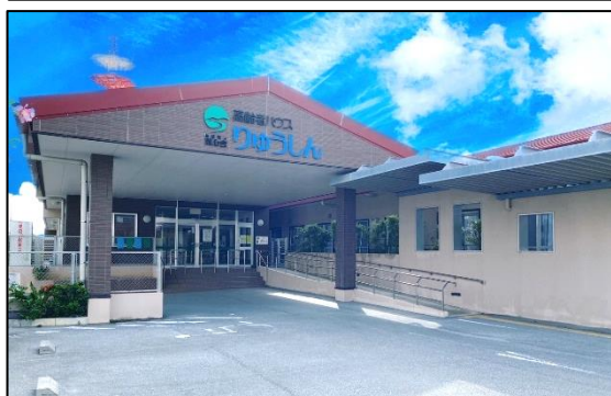
「綺麗で清潔感のある施設です」